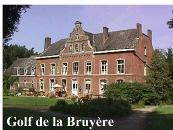
Golf de la Bruyère