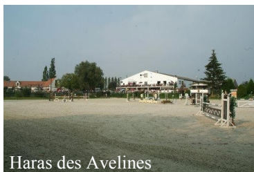
Haras des Avelines