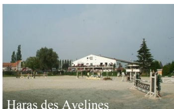
Haras des Avelines