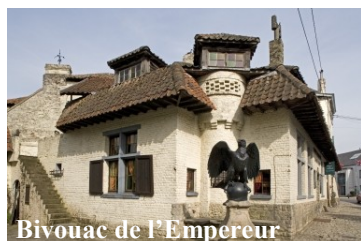
Bivouac de l'Empereur