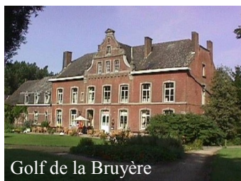
Golf de la Bruyère