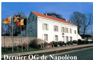
Dernier QG de Napoléon