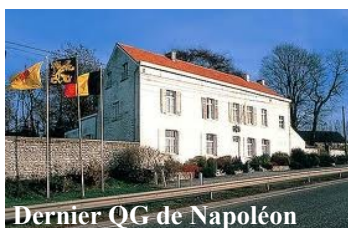
Dernier QG de Napoléon